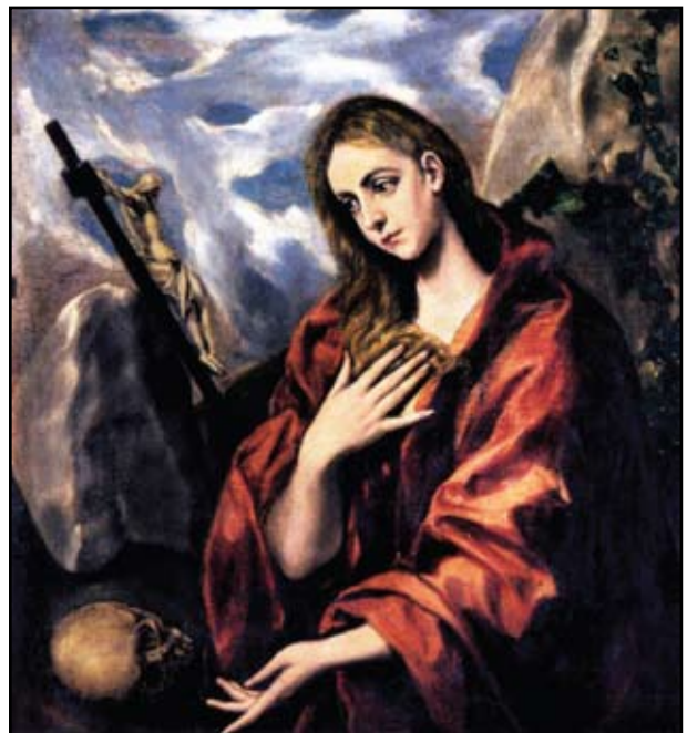
8B kép. El Greco: Bűnbánó Magdolna. Joslin Museum, Omaha

jobb oldalon 13, a balon 15 borda alkotja. A lábujjak két-két ízből épülnek fel, a lábközepcsontok közvetlenül a tibiák alatt veszik kezdetüket. A jobb singcsont félgömb alakú fejjel ízesül a humerus distalis végéhez. Egy ismeretlen nápolyi festő 1660-ból származó képén (A halál