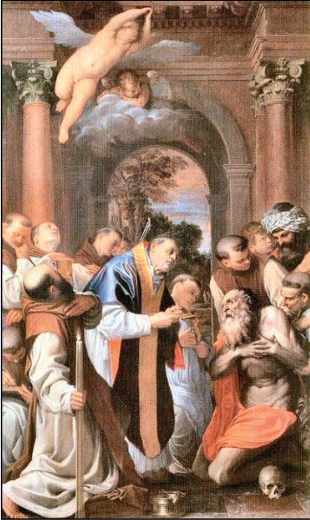
4. kép. Agostino Carrucci: Szent Jeromos utolsó áldozása. Készült 1592. Pinacoteca Nazionale, Bologna.

Tiziano Vecellio (1485-1576), 1560 körüli, Carrucci oltárlépén (7. kép) és El Greco (1541-1614), Bűnbánó Magdolna (8A, 8B, 8C. kép), valamint Georges la Tour (1593-1652) Bűnbánó Magdolna gyertyával (1644) elnevezésű műve.