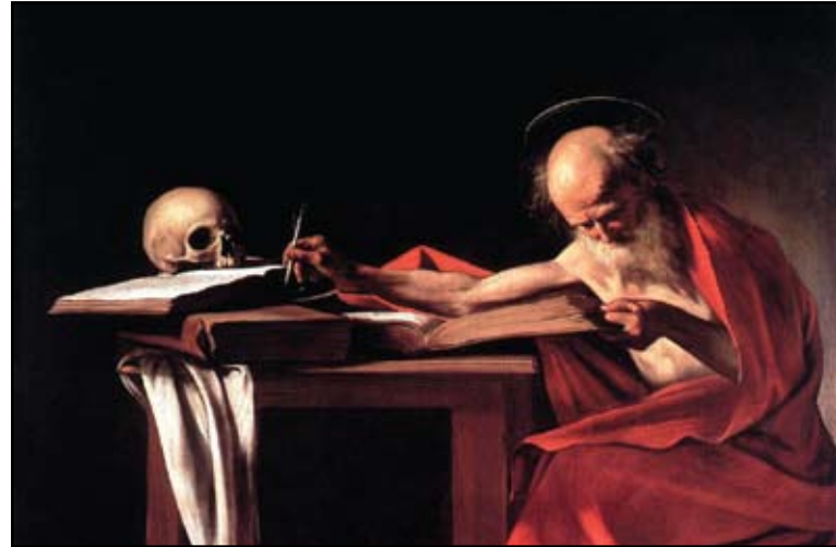
2. kép. Caravaggio: Szt. Jeromos olvas Készült 1606-ban. Galeria Borghese, Roma.

zygomaticus hiányzik, a fog-alveolusok nem különállóak, hanem egy árkot képeznek. Pontatlan a cranium megjelenítése MS mester 1506-ban készült, selmebányai oltárképén (1. kép) és Giotto di Bondone (1266-1337) festményein. Ezekon a koponyák többsége fogatlan, a mandibula ritkán jelenik meg. Paris Bordone (1500-1571) Szt. György legyőzi a sárkányt című alkotásán a szörny mellett elnagyolt koponya, mandibula fogakkal, egy femur és három borda ismerhető fel. Az alsó állkapocs Z-alakú, az ízületi vég és a processus coronoideus hiányzik, a combcsont rövid, aránytalan, a nyak csaknem egyenes folytatása a diaphysisnek. Bramatino (1460-1530) „Crucifixatio”-ként számontartott oltárképén a cranium stilizált, de mind a maxillában, mind a mandibulában teljes a fogazat. Id. Lucas Cranach (1472-1553) festményén körvonalalaiban pontos, de részleteket nem tartalmaz sem a koponya, sem a mandibula, közelükben, szinte „eldugva” csigolyák és bordák is megfigyelhetők. Taddeo Gaddi (1300-1366) Keresztrefeszítés című (1360 körül), valamint Andrea Mantegna (1431-1506) hasonló tárgyú alkotásán (1458) a kereszt tövében megfestett koponyák alig hasonlítanak a