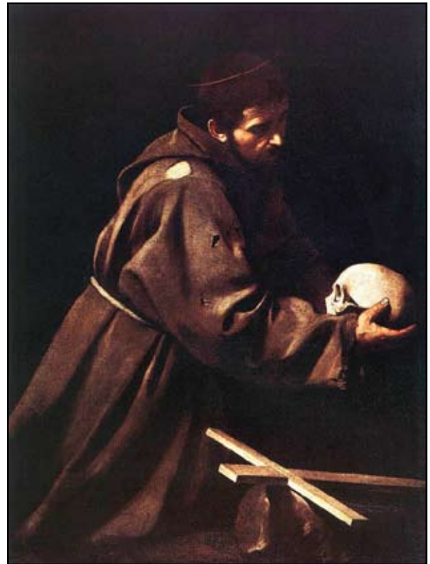
6. kép. Caravaggio: Asszisi Szt. Ferenc. Készült 1608. Galeria Nazionale d'Arte Antica, Roma