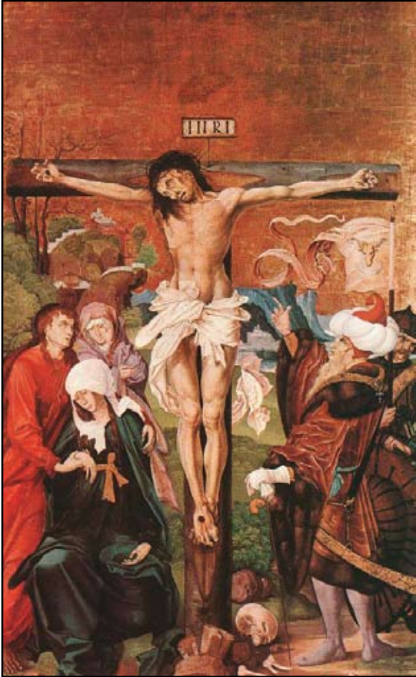
1. kép. MS mester 1506-ban készült, selmebányai oltárképe. Keresztény Múzeum, Esztergom

zygomaticus hiányzik, a fog-alveolusok nem különállóak, hanem egy árkot képeznek. Pontatlan a cranium megjelenítése MS mester 1506-ban készült, selmebányai oltárképén (1. kép) és Giotto di Bondone (1266-1337) festményein. Ezekon a koponyák többsége fogatlan, a mandibula ritkán jelenik meg. Paris Bordone (1500-1571) Szt. György legyőzi a sárkányt című alkotásán a szörny mellett elnagyolt koponya, mandibula fogakkal, egy femur és három borda ismerhető fel. Az alsó állkapocs Z-alakú, az ízületi vég és a processus coronoideus hiányzik, a combcsont rövid, aránytalan, a nyak csaknem egyenes folytatása a diaphysisnek. Bramatino (1460-1530) „Crucifixatio”-ként számontartott oltárképén a cranium stilizált, de mind a maxillában, mind a mandibulában teljes a fogazat. Id. Lucas Cranach (1472-1553) festményén körvonalalaiban pontos, de részleteket nem tartalmaz sem a koponya, sem a mandibula, közelükben, szinte „eldugva” csigolyák és bordák is megfigyelhetők. Taddeo Gaddi (1300-1366) Keresztrefeszítés című (1360 körül), valamint Andrea Mantegna (1431-1506) hasonló tárgyú alkotásán (1458) a kereszt tövében megfestett koponyák alig hasonlítanak a