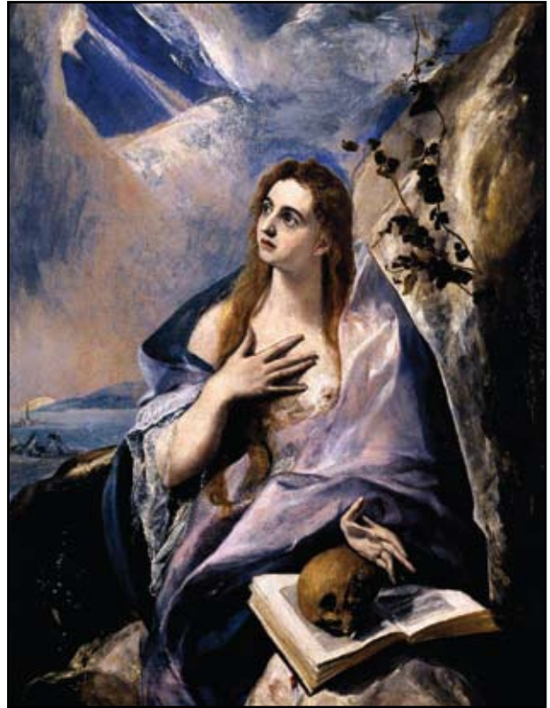
8 kép. El Greco: Bűnbánó Magdolna. Szépművészeti Múzeum, Budapest.