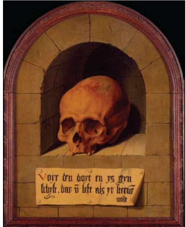
14. kép. Barthel Bruyn: Koponya fülkében Ermitázs, Szentpétervár.