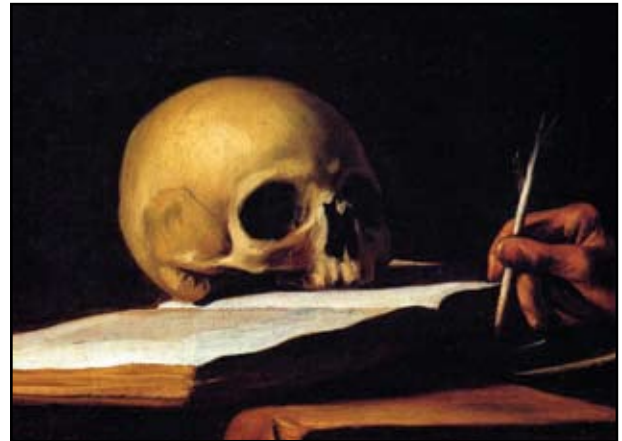
3. kép. A 2. kép kinagyított részlete.

craniumra, fogazatuk hiányos. Hans Multscher (1400-1467) Keresztvitel néven ismert oltárképén (1437) az út porában egy fogatlan cranium, egy femur és három borda hever. Anatómiai pontosságról szó sincsen, csak a körvonalak alapján állapítható meg milyen csontot akart megjeleníteni. Caravaggio (1571-1610) Szt. Jeromos festményén az olvasó szent mellett egy nyitott könyvön, anatómiaiilag szakszerű, fogatlan koponyát látunk (2. 3. kép). Az is megállapítható, hogy a foghiány postmortalisan következett be. Agostino Caracci (1557-1602) „Szt. Jeromos utolsó áldozása”-ként elhíresült képén a szent lábánál bonctanilag szabályos koponyát festett, amelynek jobb oldali frontfogai hiányoznak (4. kép). Blanchards Jaques (1600-1638) Szt. Jeromosról készített festményén a (1632) főalak kezében tartja a nagy gonddal, pontossággal ábrázolt craniumot (5. kép). Dürer 1514-ből való rajzán Szt. Jeromos cellájában oldalt, egy polcon látszik a koponya. Szent Jeromot csaknem mindig, másokat (Assisi Szt. Ferenc (8. 7. kép), Boromei Szt. Károly, Borgia Szt. Ferenc, stb.) néha szintén koponyával jelenítik meg. Bűnbánó Magdolna legtöbbször a kezében, vagy ölében tartott craniummal látható. Legismertebbek