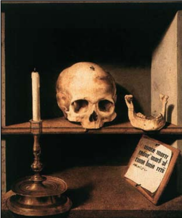
13. kép. Barthel Bruyn: Vanitas.