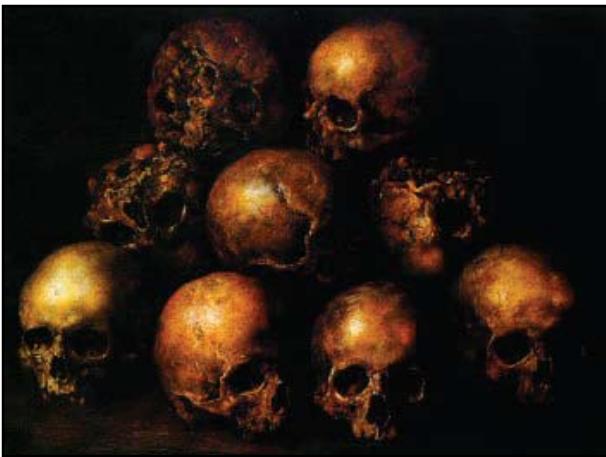
18. kép. Gottfried Libalt: Vanitatum vanitas.

Déltiroli Mester szobrát, a Feszületet, amelynek tövében sok koponyát faragott ki a művész. J.A.M. Mester 1480-ban, Zwolléban felállított síremlékén, három koponyát és egy csontvázat mintáztak meg. A művész hiányos bonctani ismereteit mutatja, hogy a lapockákat a mellkas elülső részén, a kulcsontok alatt helyezte.