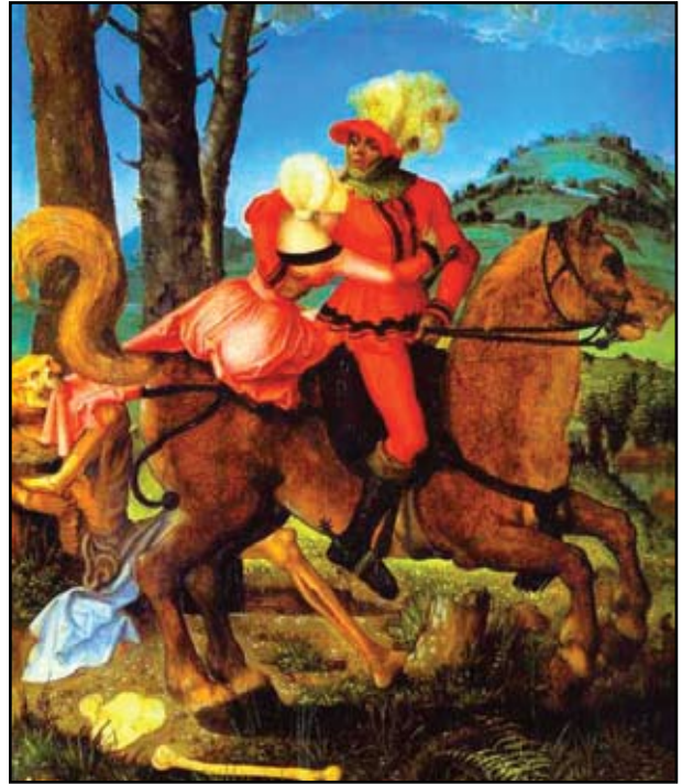
10. kép. Hans Baldung: A lovas és a halál. Készült: 1501, Louvre, Párizs.