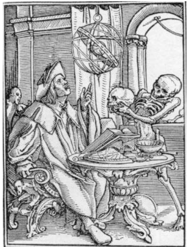
12. kép. Hans Holbein: Az orvos és a halál. Fametszet. Keresztény Múzeum, Esztergom.