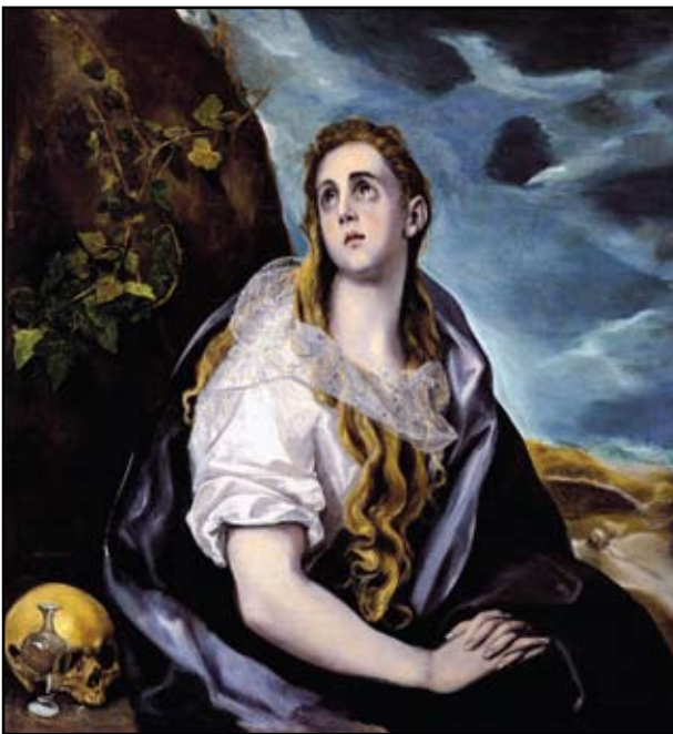
8A kép. El Greco: Bűnbánó Magdolna. Museum Cau Forrat Sittges