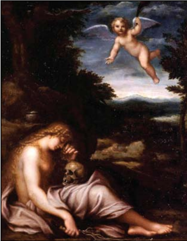
7. kép. Agostino Carracci: Bűnbánó Magdolna. Készült 1590 körül. Pinacoteca Nazionale, Bologna.