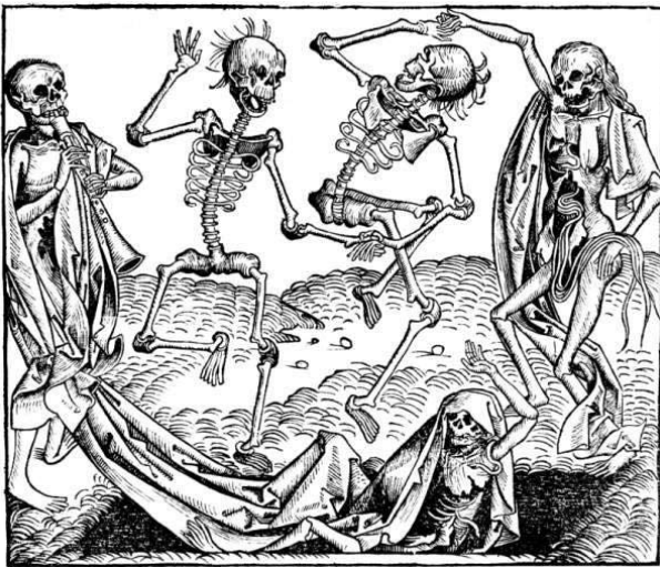
11. kép. Hans Holbein: Halottak tánca. Fametszet.