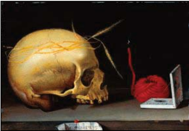
17. kép. Harmen Steenwijk: Vanitas csendélet. Készült 1640 körül. Stedelijk Múzeum, Leiden.