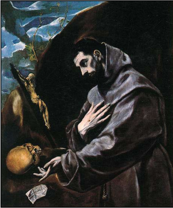
9. kép. El Greco: Asszisi Szt. Ferenc. Prado Madrid.