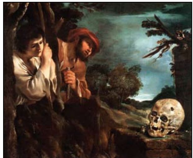
15. kép. Guercino: Et in Arcadia Ego. Készült 1618. Galeria Nazionale d'Arte Antica, Roma

alakú, hosszátmérője kétszerese a haránténak. A két koponya között végtag csont (valószínűleg tibia) helyezkedik el.