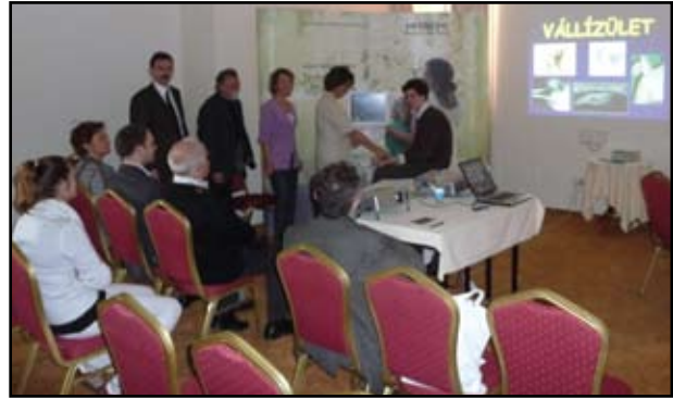
Ízületi ultrahang gyakorlat a HITACHI támogatásával