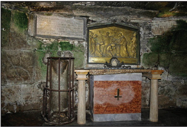
7. kép. A Mamertinum alsó kápolnájának oltára.