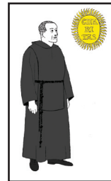
2. kép. A minimiták viselete és címere.