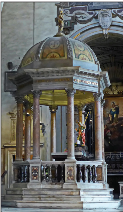
9. kép. Szent Ilona sírja.