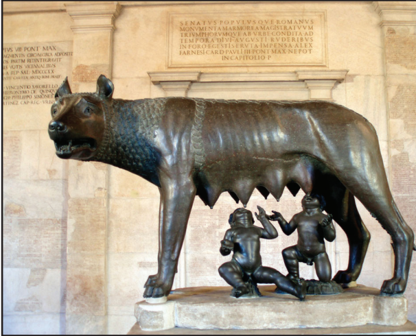
5. kép. A Capitoliumi Farkas.