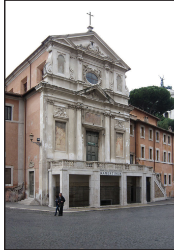
6. kép. A S. Giuseppe dei Falegnami, alatta a Mamertinum.