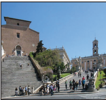
1. kép. A Capitoliumra vezető lépcsők.

A térről a Pal. Nuovo mögött balra haladva eljuthatunk a Nemzeti Emlékmű DK-i sarka felett lévő kilátóteraszhoz, illetve a S. Maria in Aracoeli oldalbejáratához. A templom a VI. sz-ban a Juno-szentély helyére épült, háromhajós, 2x11 oszlopos bazilika, aranyozott kazettás fémennyezetrel, cosmata padozattal, 21 oldalkápolnával. Benne több gótikus síremléket és reneszánsz freskót találhatunk. Mindjárt a jobb első kápolnában Pinturicchio freskói Szt. Bernardinról (1486). A jobb kereszthajóban a Savelli-síremlékek Arnolfo di Cambio-tól (6. kép). A bal kereszthajóban Szt. Ilona császárné körkápola-alakú