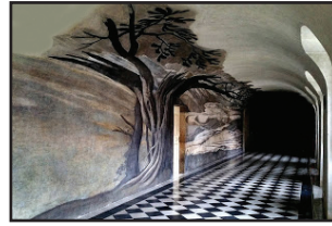
6. kép. E. Maignan freskója Szt. Ferencről.

Maignan 1636-ban egy bonyolult napórát szerkesztett az északi kolostorfolyosó mennyezetén, amelyre egy vízszintes tükör vetítette a fénysugarat. (Hasonló napórát a Spada-palota számára is készített 1644-ben.) A napóra