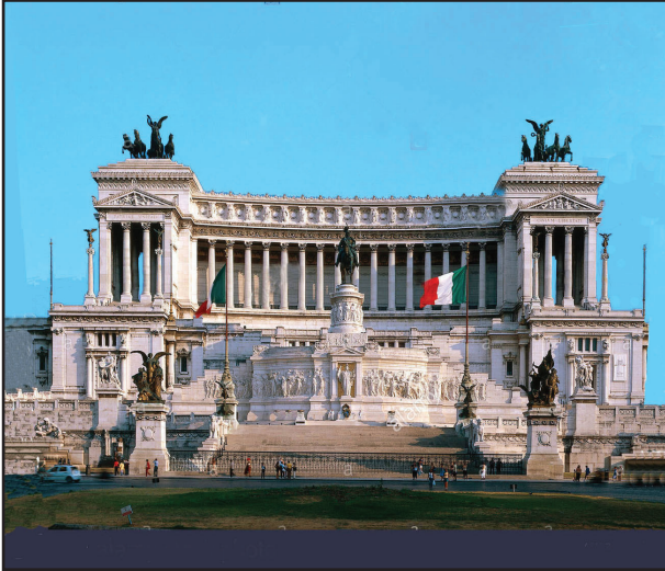
11. kép. A Nemzeti Emlékmű.

tak az ókor nevezetes államfogylyai, míg megfojtással ki nem végezték őket (pl. a Catilina-féle összeesküvés résztvevői, Vercingetorix gall vezér). A kis oltár mellett osz-