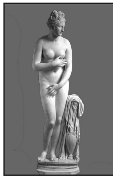
2. kép. A Capitoliumi Venus.