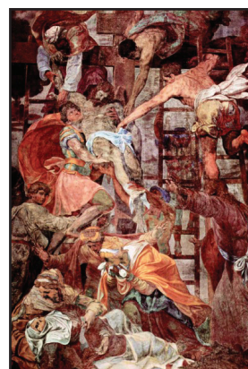
4. kép. D. da Volterra: Levétel a keresztről.