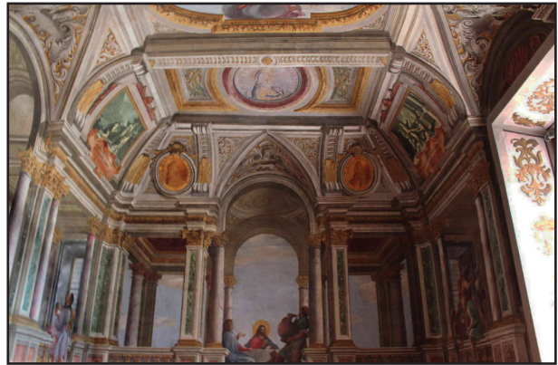
8. kép. A. Pozzo: A kánai menyegző.

azt is mutatta, hogy a világ egyes városaiban mikor van dél. A kolostor ebédlőjét (refektórium) 1694-ben a jezsuita A. Pozzo díszítette illuzionisztikus freskókkal, amelyek a kánai menyegzőt ábrázolják (8. kép). Újabbban a kolostor érdekességei tetemes belépődíj ellenében megtekinthetők váltak.