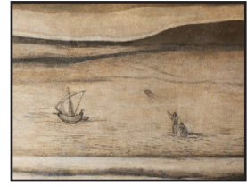
7. kép. Szt. Ferenc csodás átkelése.