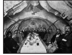
12. kép. Poharazgatás a szobor belsejében.

tak az ókor nevezetes államfogylyai, míg megfojtással ki nem végezték őket (pl. a Catilina-féle összeesküvés résztvevői, Vercingetorix gall vezér). A kis oltár mellett osz-