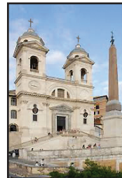
1. kép. A Ss. Trinità homlokzata az obeliszkkal.

A kéttornyú templomot XII. Lajos és XIII. Károly francia király építtette a francia minimita (paulánus) szerzetesek (2. kép) számára 1502 és 1585 között. (A rend alapítóját, Paolai Szt. Ferencet, a kalábriai remetét, bár nem volt felszentelt pap, a királyok lelki atyjuknak választották és Franciaországban marasztalták. A rend tagjai negyedik fogadalmuk értelmében húst, tojást és tejtermékeket nem fogyasztanak.) A bal oldali tornyon egy-mutatós óra van, a másik tornyon különös számlapú napórát helyeztek el (3. kép). A reneszánsz homlokzatot feltehetően C. Maderno tervezte. A bejárati lépcsőzet D. Fontanától való (1587). Az egyhajós templomban hat-hat oldalkápolnát találunk. A rács által kettéválasztott hajó boltozata még gótikus. A jobb 3. és a bal 2. kápolna oltárképe Daniele da