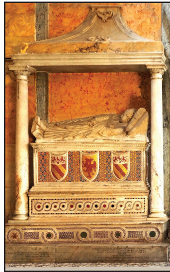
8. kép. Savelli IV. Honorius pápa síremléke (1288).