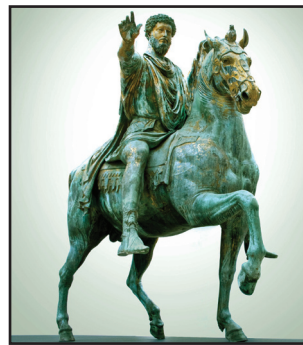
3. kép. Marcus Aurelius szobra.