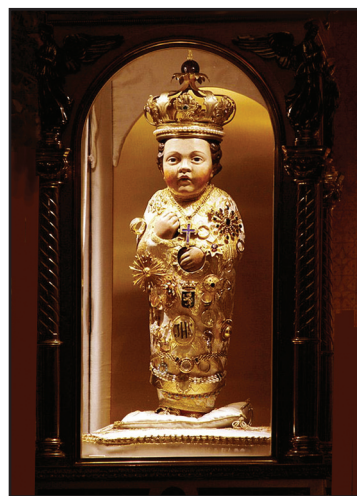
10. kép. A Santo Bambino.

síremléke (7. kép). (Nagy Constantinus anyját a Via Casilina melletti, ma már romos mauzóleumban temették el. Hatalmas porfir-szarkofágja a Vatikáni Múzeumba került.) Az innen jobbra nyíló helyiségben a gyermek Jézus 60 cm magas faszobra, a „Santo Bambino”, amelyet fogadalmi ajándékok, ékszerek borítanak (8. kép). 1798-ban a francia katonák kis híján elégették. Az eredeti kegyszobrot, amely a XV. sz.-ban a jeruzsálemi Getszemáni-kert olajfájából készült, 1994-ben ellopták, ma már csak másolata látható. A XIX. sz.-ban a csodatévő szobrot kórházakba, illetve a járásképtelen betegekhez is elvitték. Ehhez Torlonia herceg biztosított díszhintót. Karácsonykor a világ minden tájáról érkeznek gyermekektől levelek a Santo Bambinóhoz, ezeket a templomot gondozó ferences szerzetesek összegyűjtik, és időnként felbontatlanul