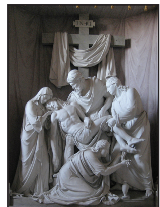
5. lép. W. Achtermann: Levétel a keresztről.

Volterra műve: „Mária mennybemenetele” illetve „Levétel a keresztről” (1545, 4. kép). Az utóbbi a manierizmusra