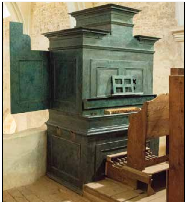
5. kép. Az orgona.

átépítették, gótikus keresztboltozattal és rózsablakkal látták el. A XVI. elején az apátság elnéptelenedett, majd romossá vált. A templomot 1732 és 1745 között – egy ott élő remete szorgalmazására – gróf Erdődy Gábor egri püspök támogatásával újjáépítették. A XX. században évtizedekre elhúzódóan restaurálták. Eredeti berendezéséből semmi sem maradt. A XVIII. századból származó berende-