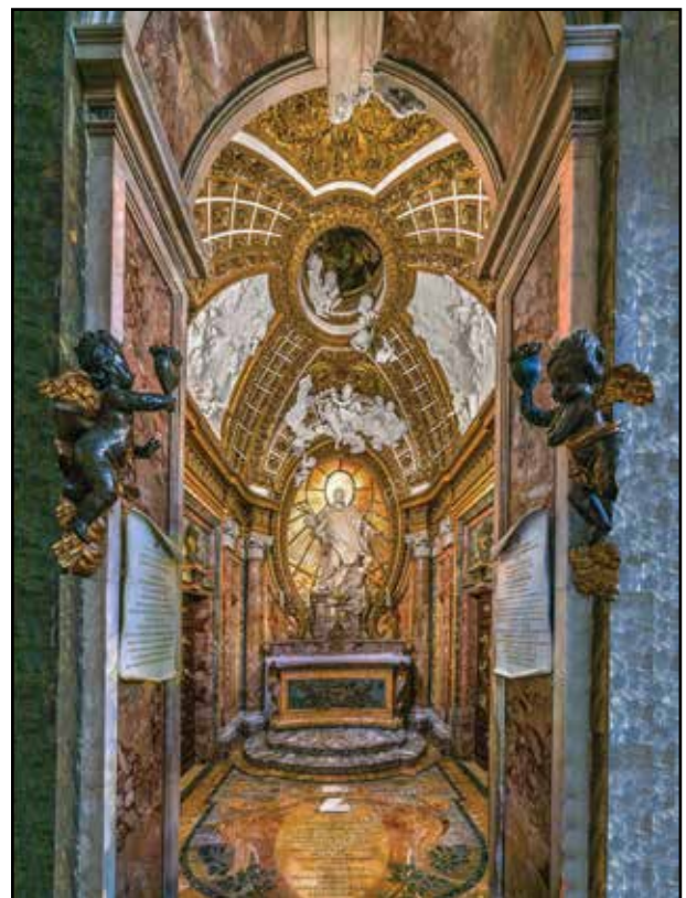
5. kép. Az Antamoro-kápolna