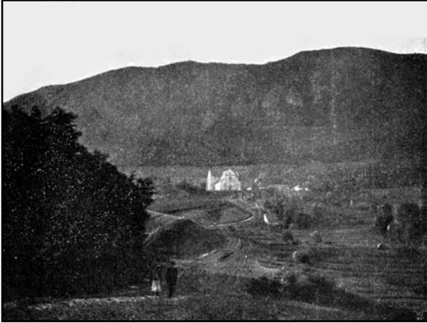
6. kép. A Bélkő-hegy 1900-ban, Bélapátfalva felől [1].