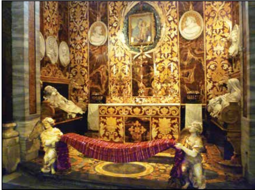
3. kép. A Spada-kápolna