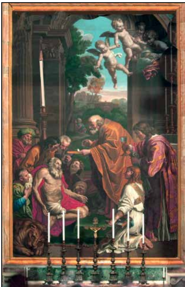
4. kép. A főoltár képe