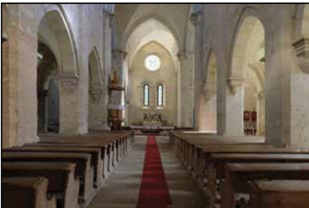
4. kép. A templom belülről.

átépítették, gótikus keresztboltozattal és rózsablakkal látták el. A XVI. elején az apátság elnéptelenedett, majd romossá vált. A templomot 1732 és 1745 között – egy ott élő remete szorgalmazására – gróf Erdődy Gábor egri püspök támogatásával újjáépítették. A XX. században évtizedekre elhúzódóan restaurálták. Eredeti berendezéséből semmi sem maradt. A XVIII. századból származó berende-