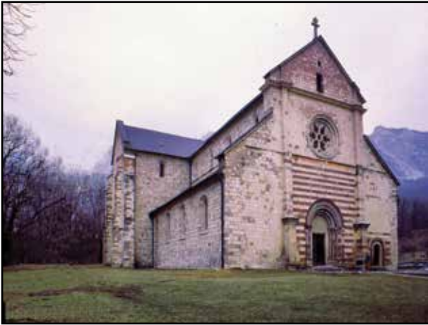
2. kép. A templom homlokzata.