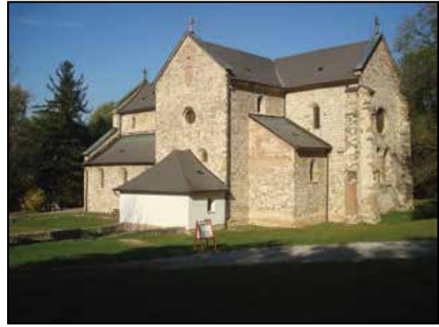
3. kép. A templom déli oldala.