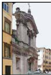
1. kép. A templom homlokzata

Rómában, a Via di Monserrato és a Via di San Girolamo della Carità utca sarkán álló, igen régi Szt. Jeromos-templomot Domenico Castelli építette újjá 1654-ben. Barokk homlokzatát Carlo Rainaldi fejezte be (1660. 1. kép). (Ennek felső része csak álhomlokzat, mögötte az épület jóval alacsonyabb.) A templom melletti oratoriánus