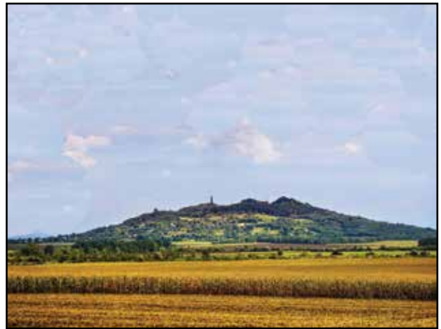
9. kép. A Haláp.