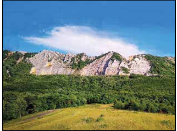
7. kép. A Bélkő-hegy jelenlegi állapota.