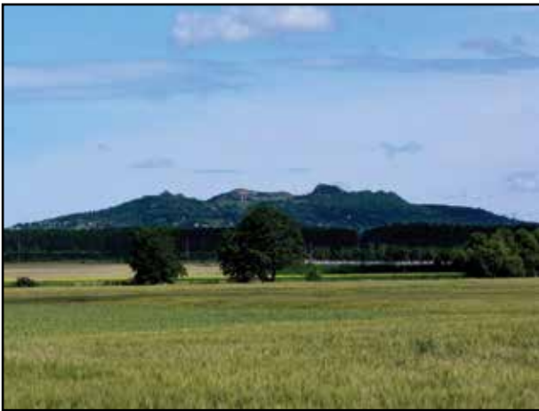
8. kép. A Ság-hegy.