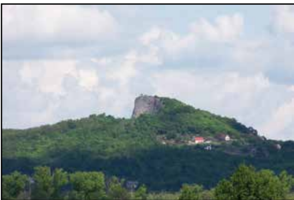
10. kép. A Hegyestű.

zési tárgyai a barokk padokon kívül a jobb oldali mellék-szentély kis rokokó oltára és a copf-stílusú szószék. 1775-ben készült, 8 változatú műemlékorgonája ma is működik.