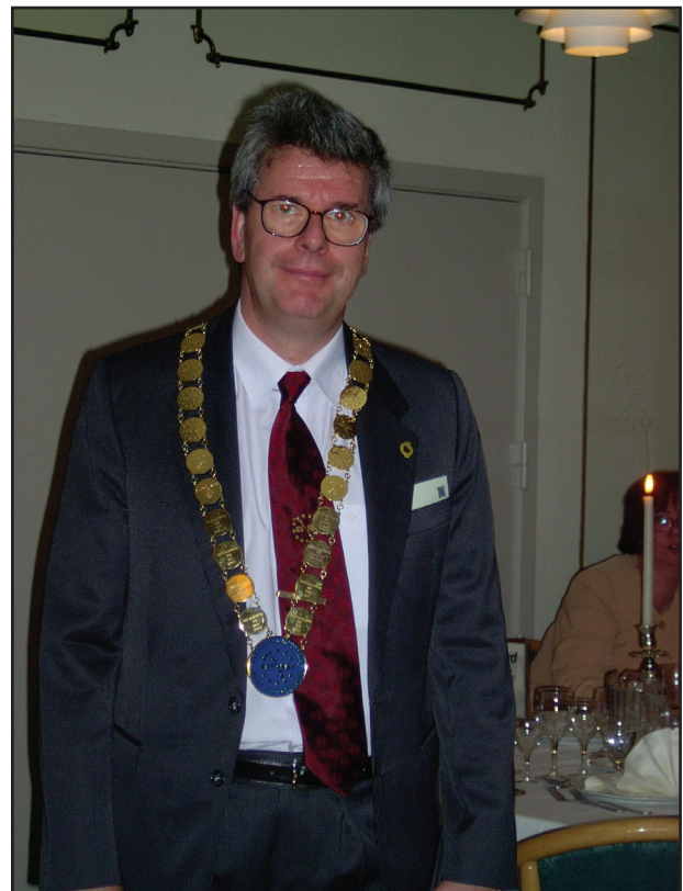
Mester dr. lett az ESSR elnöke (2002).