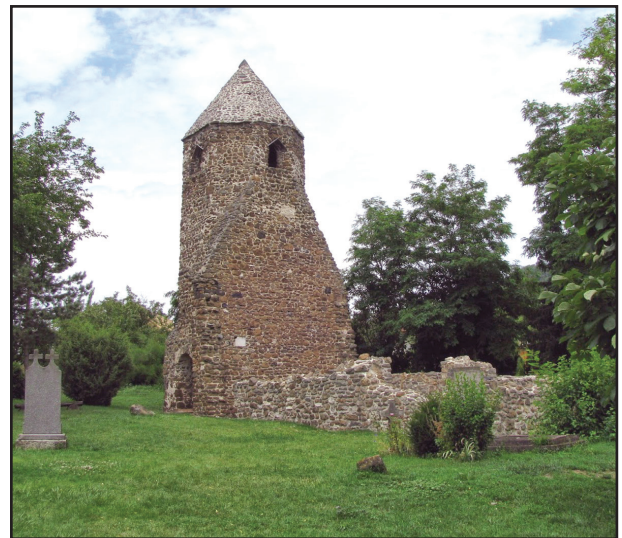
10. kép. Az avasi templomrom

Balatonparti utunkat folytatva jobbról feltűnik a Badacsonyi hatalmas tömege, majd az út mellett az avasi templomrom (10. kép). A Mindenszentek titulussal bírt templom hajója – a falazás technikájából következő – római-kori épület maradványa lehetett, amelyhez a középkorban szentélyt, sekrestyét, csontházat és tor-