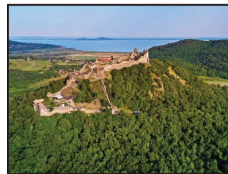
3. kép. A vár (légi felvétel)