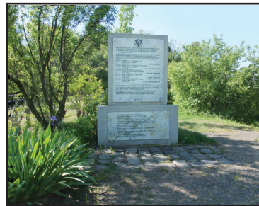
9. kép. Az amerikaiak emlékműve

Az üdülőkkel telehintett Aranykagyló völgy után találjuk a hajóki-kötőt, majd balról a 168 m magas Rókarántó dombot (8. kép). Ennek nyergében fehérlik az 1847-ben épült,