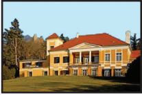
5. kép. A kastély a park felől