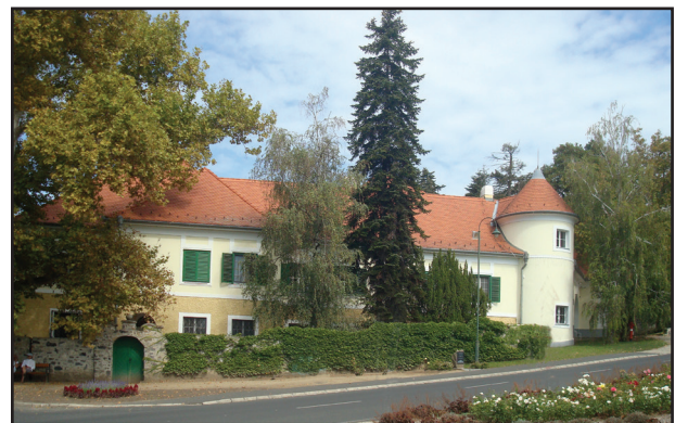
4. kép. A kastély déli oldala