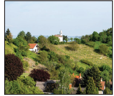
8. kép. A Rókarántó a Szentháromság kápolnával