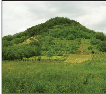
6. kép. Az Óvár