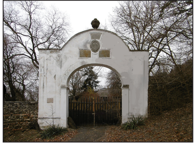
1. kép. A Lengyel kúria kapuja

A főutca balra kanyarodva kivezet a Balaton-partra. A stranddal szemben emelkedik az Óvárhegy , avagy a Királyné Szoknyája nevű 186 m magas, kúpalakú bazalt-hegy (6. kép). Erdővel borított tetején a kicsiny Óvár alapfalait tárták fel (7. kép). Ennek építési ideje és rendeltetése ismeretlen, Faragott kövei arra utalnak, hogy talán még a római időkből származik. Toronymaradványa felett faszervezetű kilátó épült. A romokészakról, az Erdőaljai