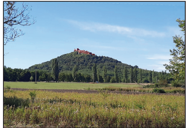
2. kép. A Várhegy keletről