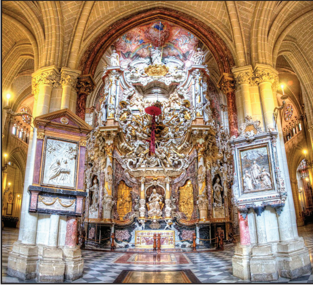
3. kép. A Tranparente.