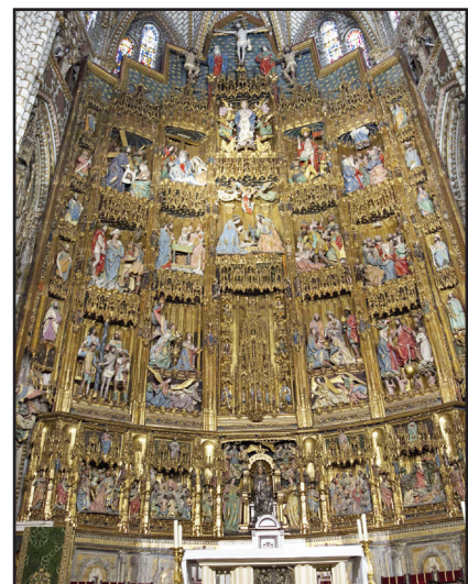
2. kép. A főoltár a retablóval.

A sötét csarnokban az oltár megvilágítását úgy oldották meg, hogy előtte a boltozatban egy nagy, kerek nyílást vágtak, amely feljebb dolgo boltozatot fedtek. A nyílás szélén szobrok ülnek, mintha letekintve az oltárra (4. kép). A boltozat alá egy alulról nem látható oldalablakon át jut be a fény, amely az oltárdíszítmény rejtett nyílásán (5. kép) át hátulról a főoltár tabernaculumát is megvilágítja (innen a Transparente-név). A gazdagon díjazott művet sokan a világ nyolcadik csodájának nevezték. Az oltárral szemben van a megrendelő érsek sírja. Bíborosi kalapja az oltár előtt, a mennyezetre van függesztve (3. kép).