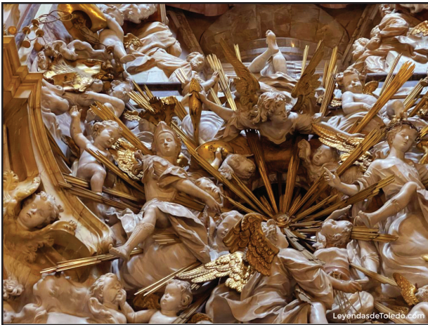
5. kép. A Transparente részlete.