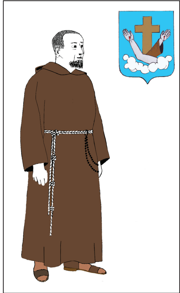
3. kép. A kapucinusok öltözete

gallérral és hegyes csuklyával (2. kép). Kötélövükön balról olvasó. Sarut és rövid, barna körgallért viselnek.