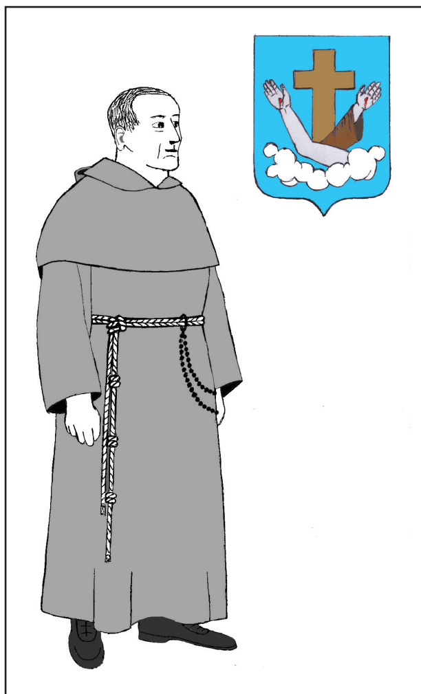
1. kép. A minoriták öltözete

A rend hamar elterjedt Itáliában, majd egész Európában. Magyarországon már 1233-ban létezett rendtartományuk. Később négy rendre váltak szét. Ezekben közös, hogy alapvetőnek az „apostoli szegénységet” tartják. Címükben két, keresztbe tett kar látható (az egyik Jézusé, a másik Szt. Ferencé). főnöküket minister generalisnak nevezik. Jelmondatuk: Pax et bonum (béke és jóság). Fehér kötélövük jobbról lelógó egyik végén három csomó van, a hármass szerzetesi fogadalom jeleként. Habitusuk színe kezdetben világosszürke volt (1. kép).