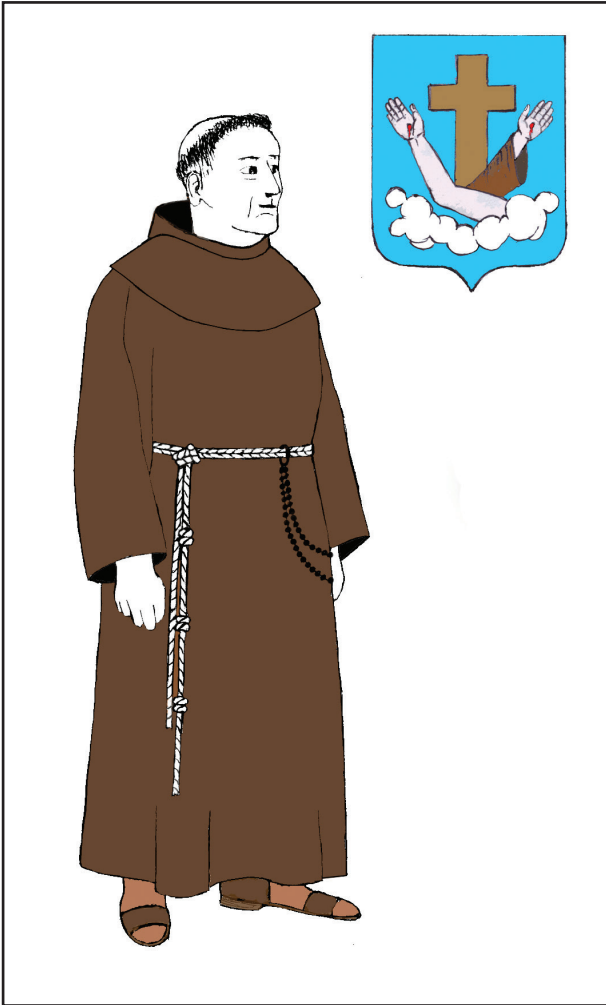
2. kép. A ferencesek öltözete